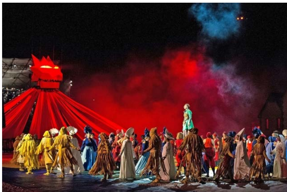
Le spectacle «Solstices» et ses personnages fantastiques ont conquis le public. La fête peut maintenant s'étendre à Échallens.

Échallens Lancée par un spectacle qui conquiert la majorité du public, la fête va pouvoir s'étendre à l'ensemble du bourg.